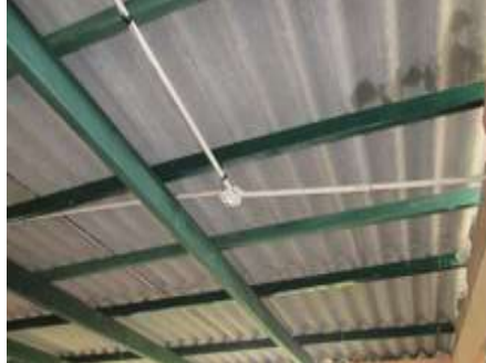
Planta de Tratamiento – Impermeabilización de cubierta