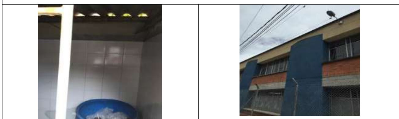
Enchape de cuarto de basuras – instalación de protectores de ventanas