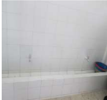
Impermeabilización cubierta de baños - Reparación daños por humedades en baños - terminación enchape lavamanos