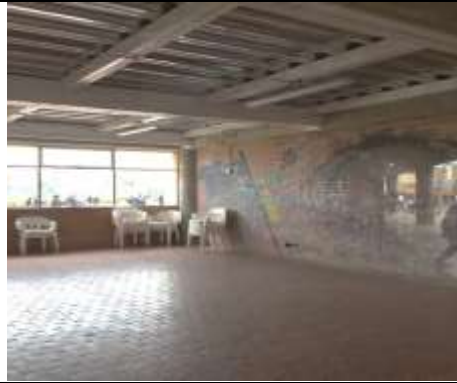
Mantenimiento de estructura de cubierta – habilitación de aulas