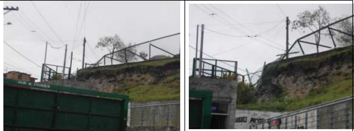
Cerramiento colapsado en la parte alta de terreno, daño cuya solución que no hace parte del contrato.

COLEGIO MORALBA SURORIENTAL SEDE A - Dirección: Calle 43 sur transversal 16 Este - Carrera 16 A Este # 42 C - 80 sur