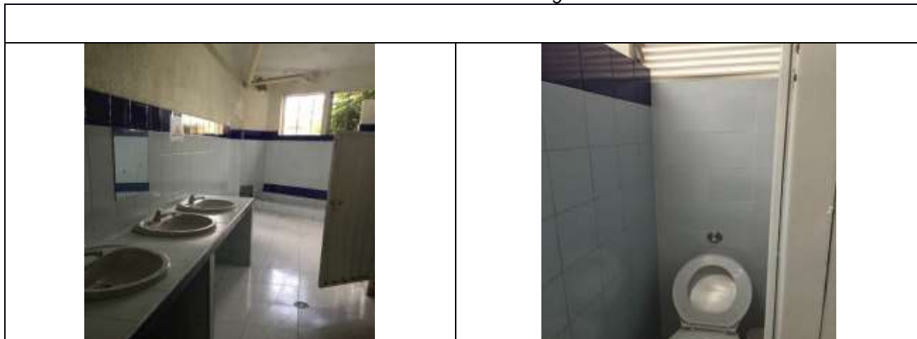
Intervención de baños en primer y segundo piso