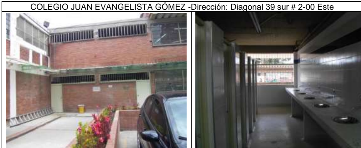
Adecuación de dos baterías sanitarias