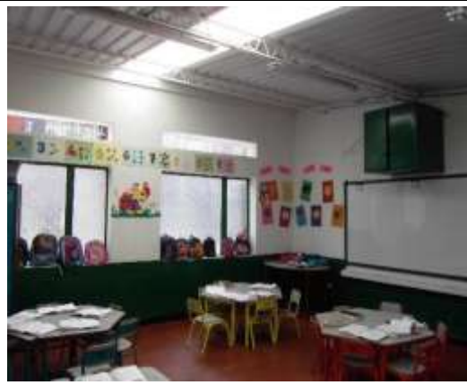
COLEGIO FERNANDO MAZUERA VILLEGAS -Dirección: Calle 74 F sur #83 A -21