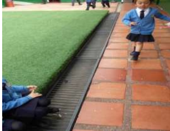
Se instalaron algunos módulos de rejillas metálicas en cañuela perimetral.