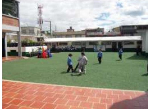
Grama sintética instalada en el área recreativa.