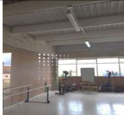
Construcción de aulas adicionales en espacio disponible

Fuente: Acta de visita de carácter fiscal de julio de 2015.