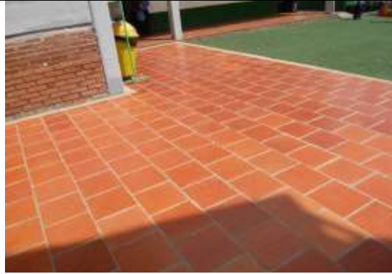
Piso instalado en el acceso al colegio.

CEDID SAN PABLO SEDE B LA AMISTAD - Dirección: Carrera 79 A N°65-75 sur