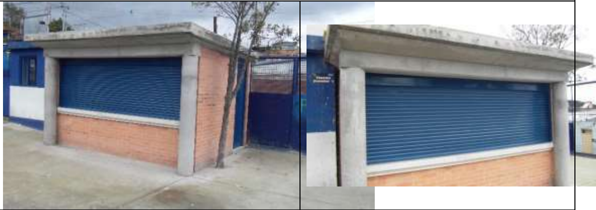
Construcción de tienda escolar

COLEGIO JOSÉ JOAQUÍN CASTRO MARTÍNEZ SEDE A - Dirección: Calle 31 D Bis sur # 2-24 Este