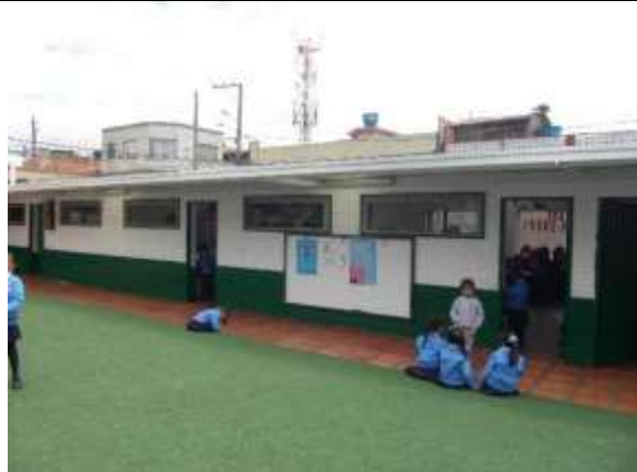
Pintura de muros tanto exteriores como interiores del plantel educativo y carpintería metálica.