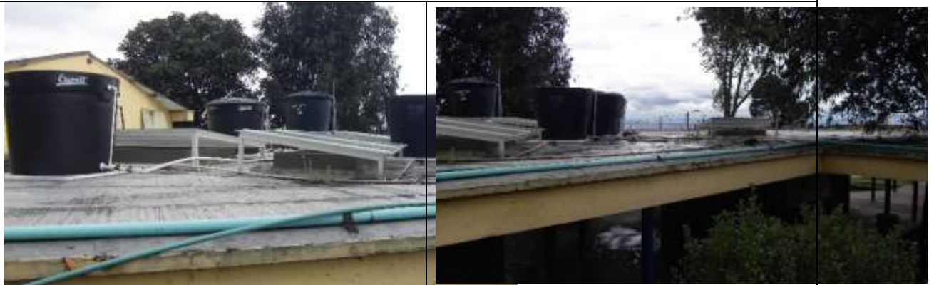
De otra parte se instalaron cubiertas policarbonato sobre baterías sanitarias, con estructura metálica, en bloque de aulas.

COLEGIO SAN JOSÉ SURORIENTAL SEDE A- Dirección: Calle 42 sur # 12 A-66 Este