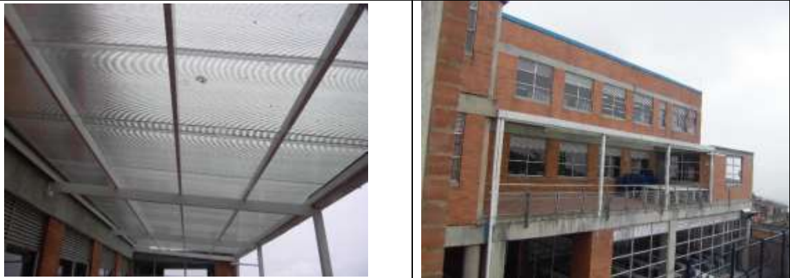
Intalación de cubierta en policarbonato con estructura metálica en terraza del plantel educativo.

COLEGIO SAN JOSÉ SURORIENTAL SEDE A- Dirección: Calle 42 sur # 12 A-66 Este