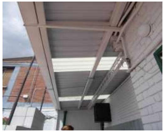
Se instaló teja Cindu Climatizada y estructura metálica.