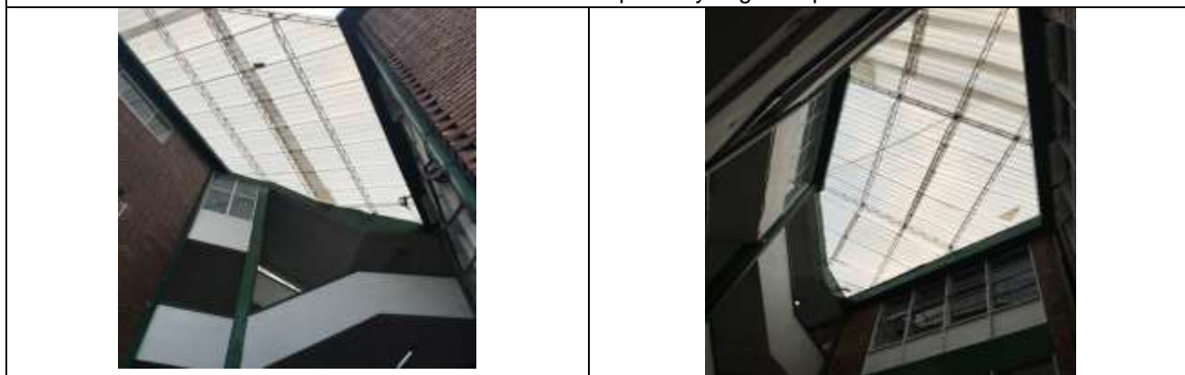
Reemplazo de tejas en cubierta de punto fijo