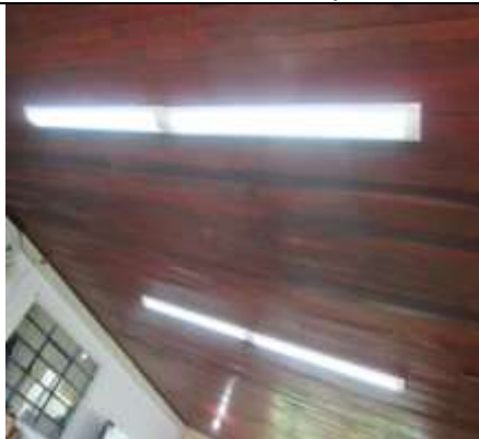
Reparación cielo raso – Planta de Tratamiento