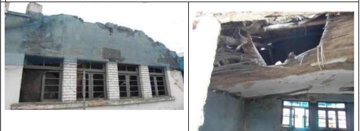
Derrumbe de vértice de fachada en mampostería.

Se pudo evidenciar el avanzado estado de deterioro que presenta el inmueble declarado bien de interés cultural y que se encuentra en estado de ruina, el cual aún no ha sido atendido en su recuperación por parte de la Secretaría de Educación Distrital.